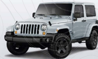
WINTER CHILL METALLIC*